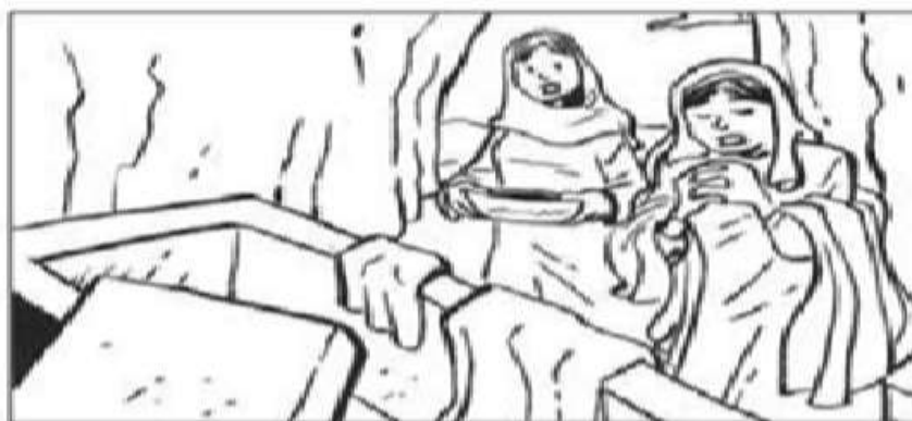
DOMINGO DE RESURRECCION