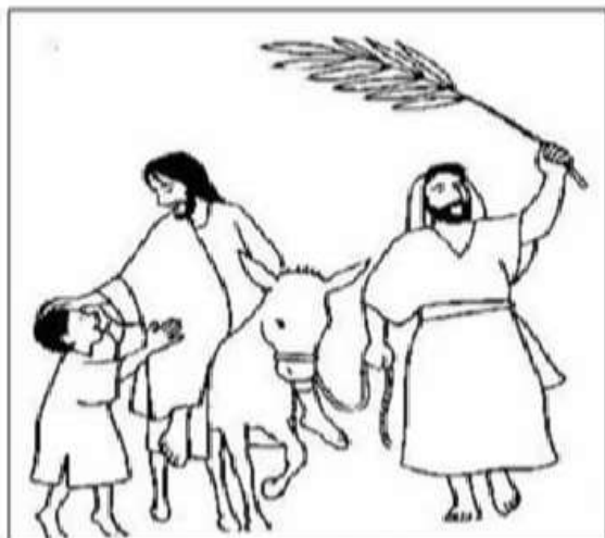
DOMINGO DE RAMOS